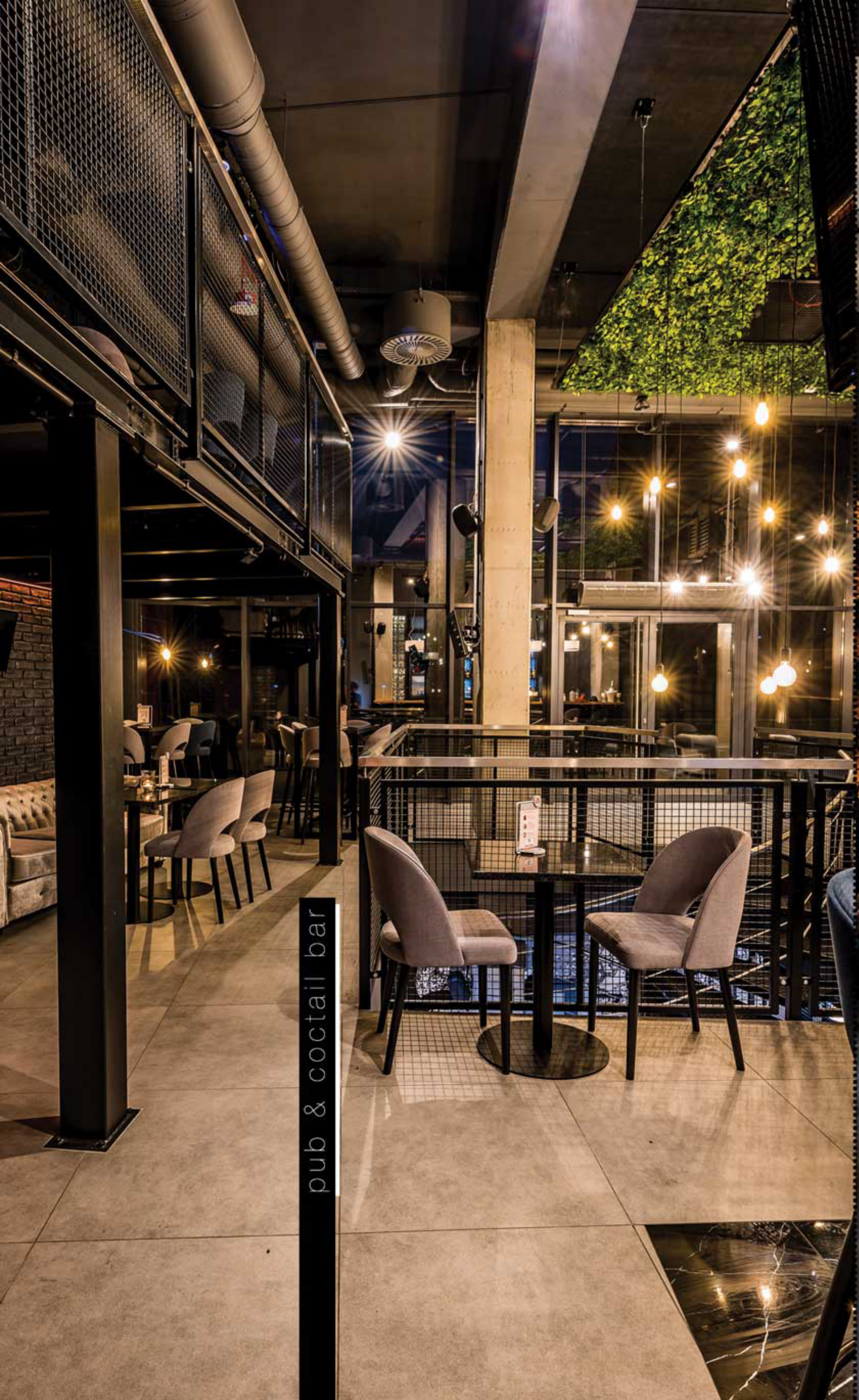
pub & cocktail bar